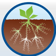
AMINO Active je prírodný fyzio-stimulant