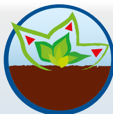
Aminokyseliny podporujú vývoj rastlín až do ich zberu